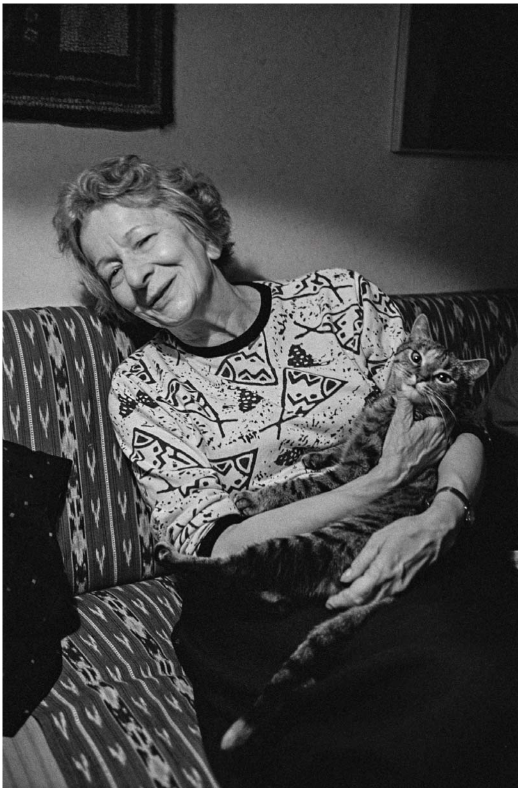
Poetka z kotem Andersa Bodegårda, fot. Joanna Helander

Pierwsze próby miały miejsce już w czasach gimnazjum w Rudzie, w ciemni, którą miał ojciec przyjaciółki. I to było ważne przeżycie. Sensualne. Ono pchnęło mnie w stronę fotografii bardziej niż jakiegokolwiek późniejsze fascynacje wielkimi fotografikami. Na pierwszą gwiazdkę w Szwecji dostałam bardzo dobry aparat fotograficzny, zrobi-