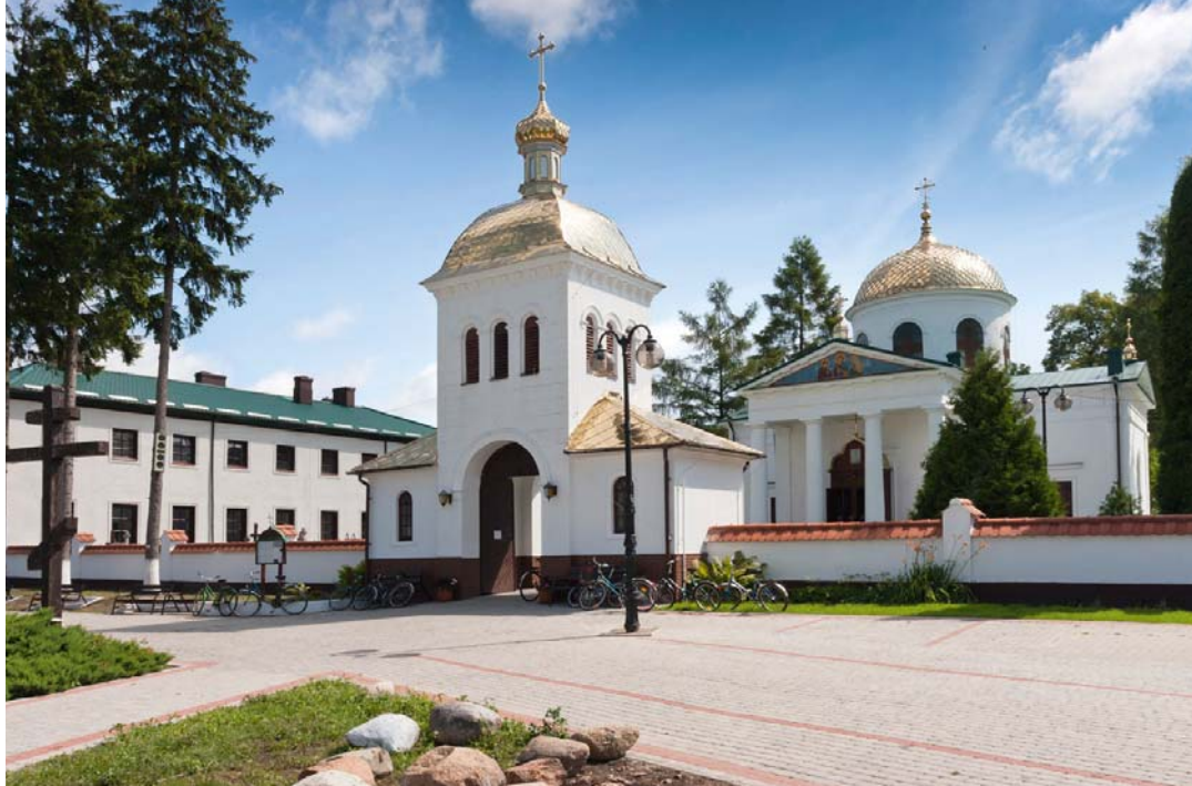
Monaster św. Onufrego

Ponad 500 lat temu w starorzeczcu leniwej meandrującego Bugu wzniesiony został prawosławny klasztor i cerkiew. Ich lokalizacja jest oczywiście nieprzypadkowa. Jak wieść gminna niesie, pewnego dnia miejscowym rybakom ukazał się św. Onufry i wygłosił niezrozumiałe dla nich zdanie: „Już zawsze imię moje będzie tutaj chwalone”. Gdy parę dni później w to samo miejsce nurt rzeki przyniósł ikonę świętego, wszystko stało się jasne. Mieszkańcy uznali to wydarzenie za znak od niebios i postawili kapliczkę pod wezwaniem świętego, która z biegiem lat i dzięki fundacjom możnych protektorów urosła do rangi znaczącego ośrodka monastycznego. Obecnie zespół składa się z cerkwi, klasztoru, domu pielgrzyma i dzwon-