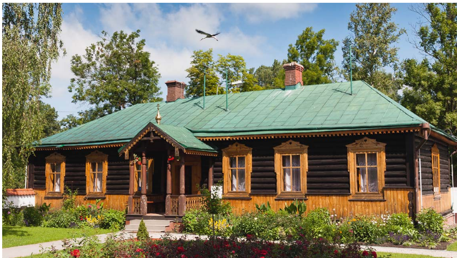
Dom namiestnika klasztoru

| Tekst: Anna Grychowska