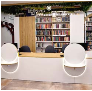
Na okładce: Wnętrze Filii nr 44

Redaktor naczelna: Izabela Ronkiewicz-Brągiel Z-ca redaktor naczelnej: Paulina Knapik-Lizak