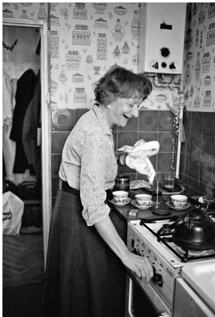
Wisława Szymborska w swoim mieszkaniu przy ul. Chocimskiej, Kraków 1983