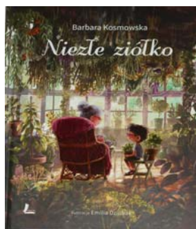
Kosmowska B., Nieźle ziółko , Łódź: Wydawnictwo Literatura, 2017