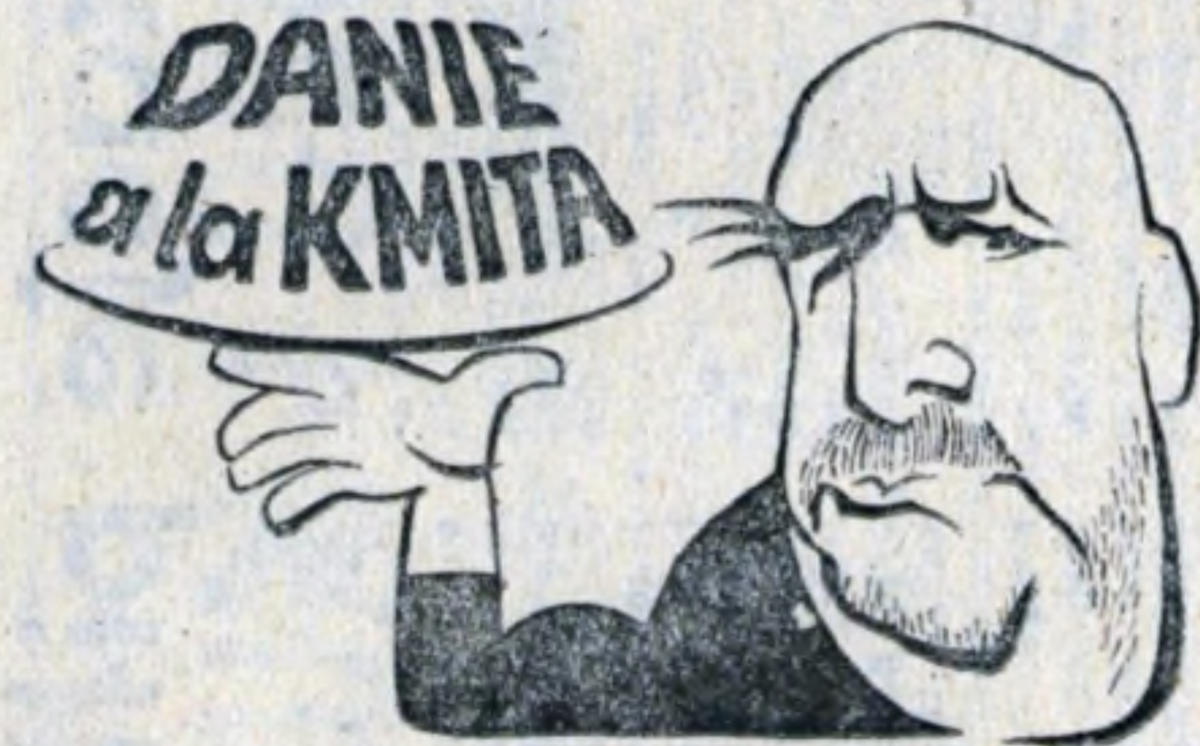
Schab po redaktorsku

BLIŹNIĘTA (21 V — 20 VI). W najbliższym czasie zabierzesz się do przeliczania oszczędności, planowania nowych inwestycji. Robisz to w odpowiednim czasie, więc mo-