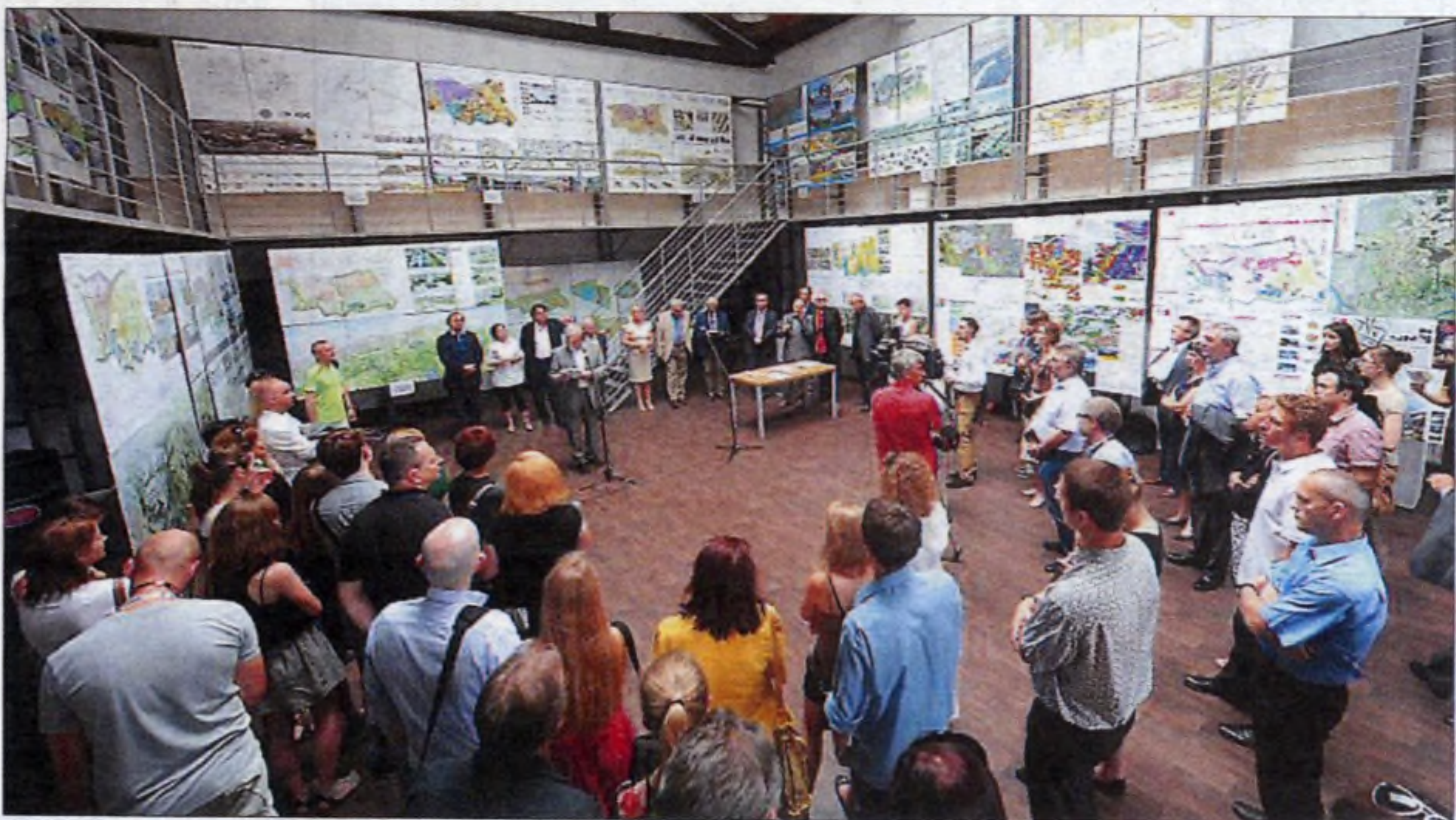
Konkurs NHP 2012.