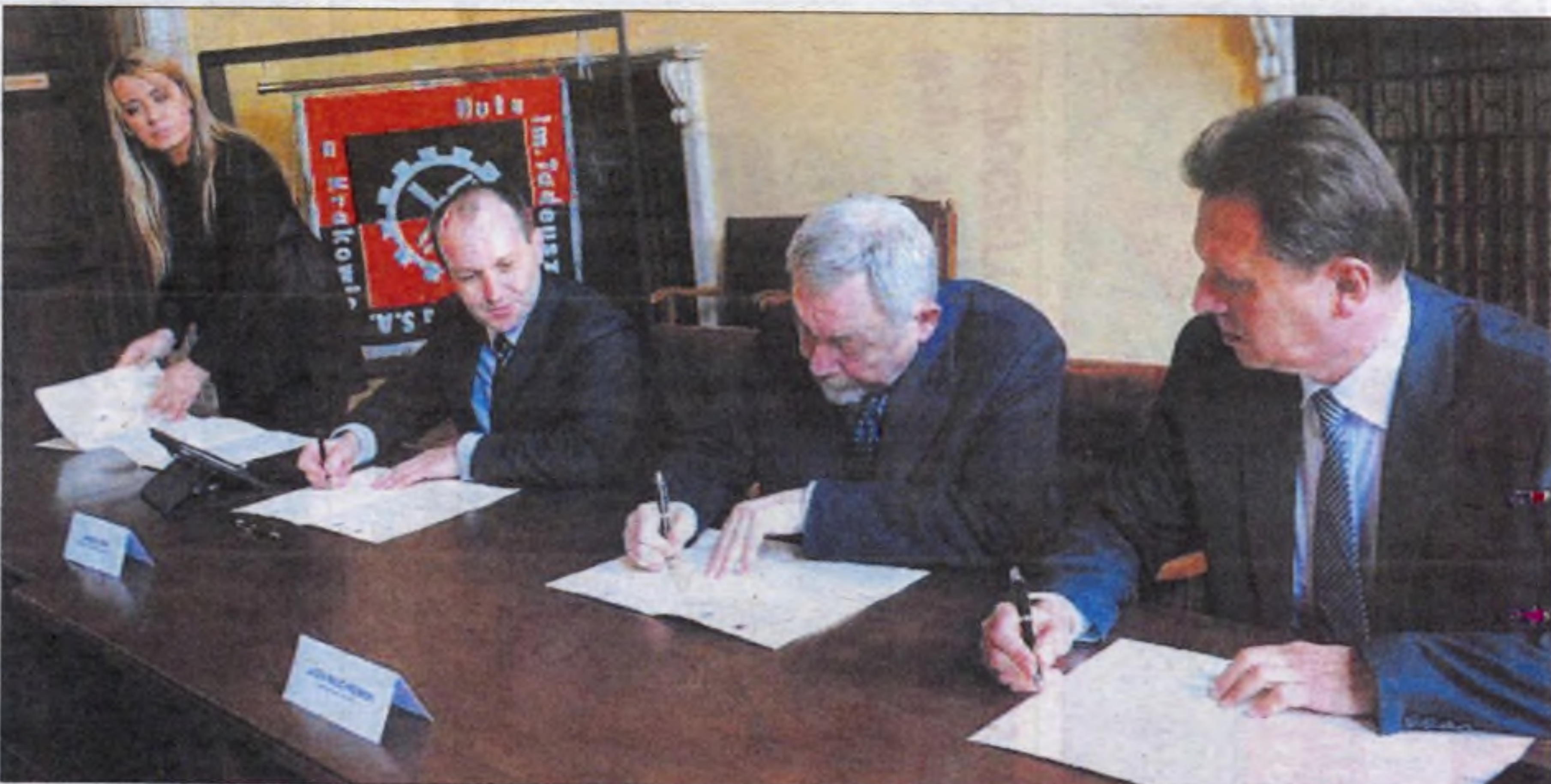
Porozumienie NHP 2013.