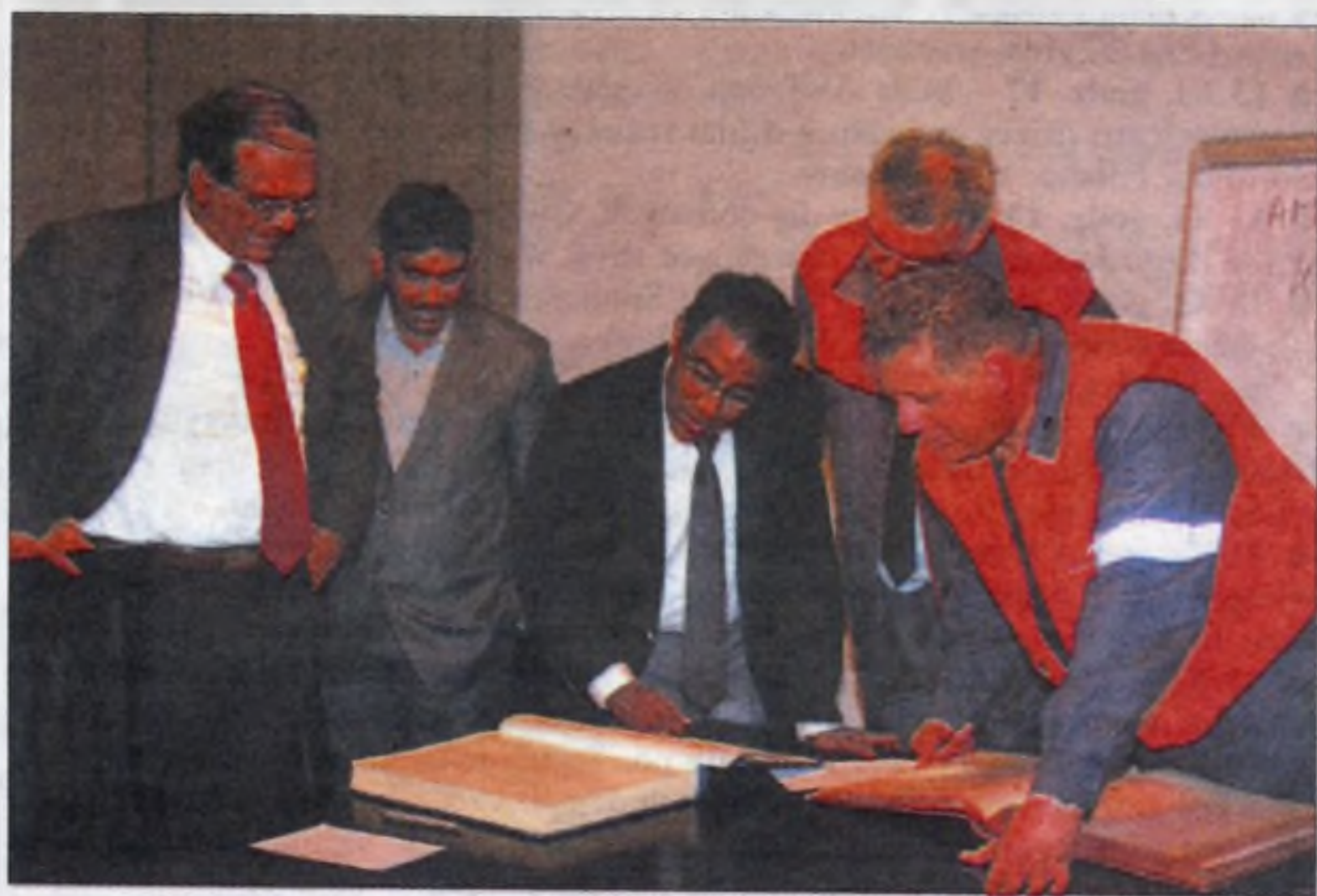
Przed wpisem do księgi, w której widnieje też nazwisko legendarnego przywódcy Indii - Nehru i jego córki Indiry Ghandi.