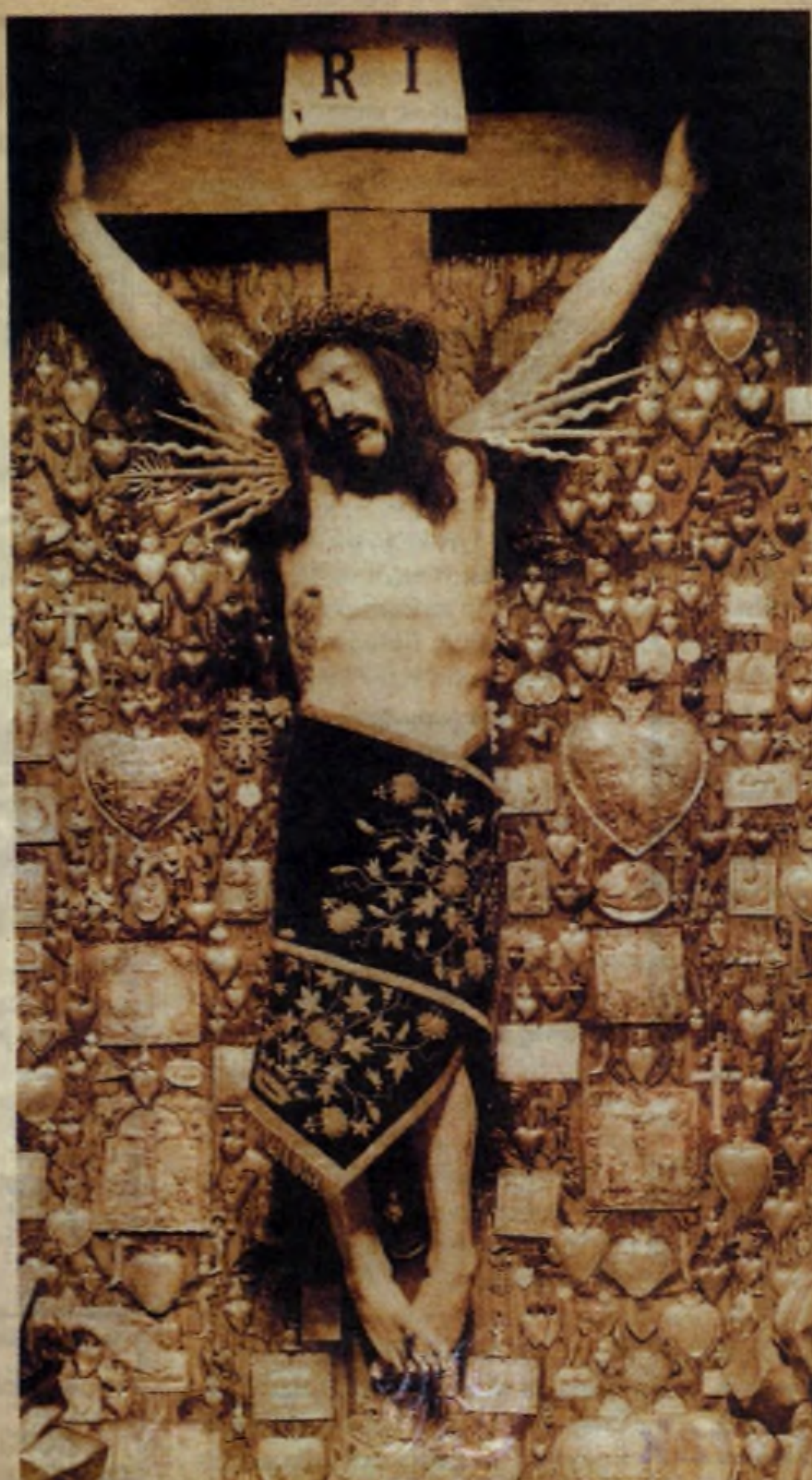
Zdjęcie łaskami słynącego wizerunku Chrystusa Ukrzyżowanego w kościele klasztornym cystersów w Mogile z początku XX wieku