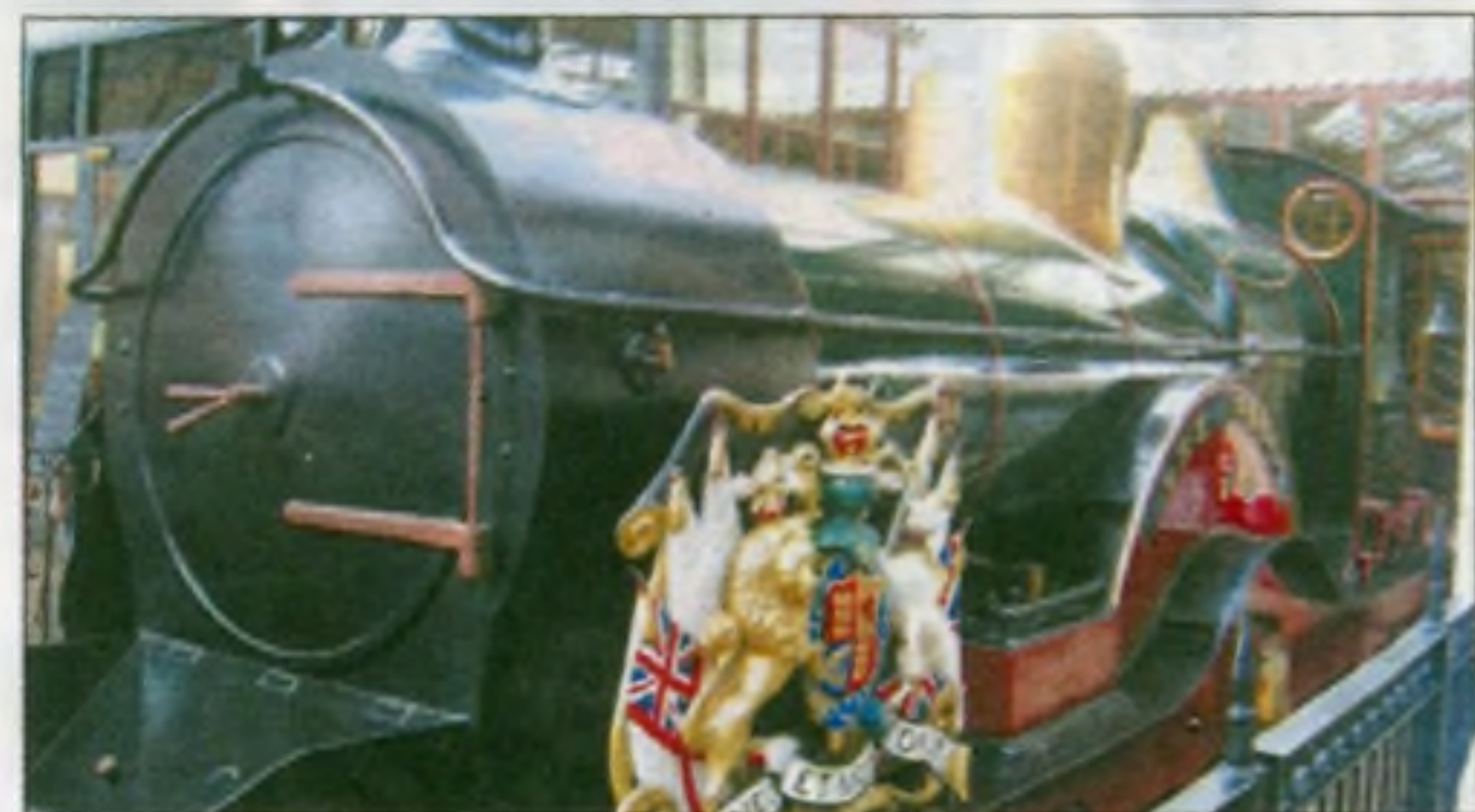
Lokomotywa pociągu królowej Wiktorii na stacji w Windsorze.

Jest piękny, rześki dzień. Przyjechaliśmy do Windsoru, my autokarem, ale można tu się dostać pociągiem w ślad za królową Wiktoria, która przybywała tu swoim wagonem królewskim. Dziś Windsor Castle jest jedyną na świecie budowlą o tym charakterze i wielkości, zamieszkiwaną nieprzerwanie od stuleci na stałe. Położony na paśmie gruntu wapiennego wznosi się na 100 stóp nad Tamizą. Do posiadłości królewskiej należy park o powierzchni 5000 akrów, dawniej obejmujący także wielki bór Windsor Great Forest, gdzie Henryk VIII polował z sokołem na dziki i jelenie. Na dziedzińcu oglądamy uroczystą zmianę warty i gwardię podczas parady. Mamy wszystko na wyciągnięcie ręki, gdyż nie ma tu takich tłumów jak pod Buckingham Palace. Przez pięknie utrzymane ogrody „Motte” udajemy się oglądać przepych zamku królewskiego, który do dziś zachował piętno osobowości każdego z zamieszkujących go kolejno przez ponad 900 lat monarchów. Np. Jerzy IV dołożył starań, by zamek upiększono, Wieża Round Tower została podwyższona o 10 m, dobudowano kilka wież i bastionów, zaś słynna walka pod Waterloo wpłynęła tak bardzo na wyobraźnię króla, iż kazał zrealizować salę „Waterloo Chamber” poświęconą zwycięstwu armii koalicyjnej nad Napoleonem. Królowa Elżbieta II reprezentuje dynastię Windsor przyjętą w 1917 r. przez Jerzego V w celu za-