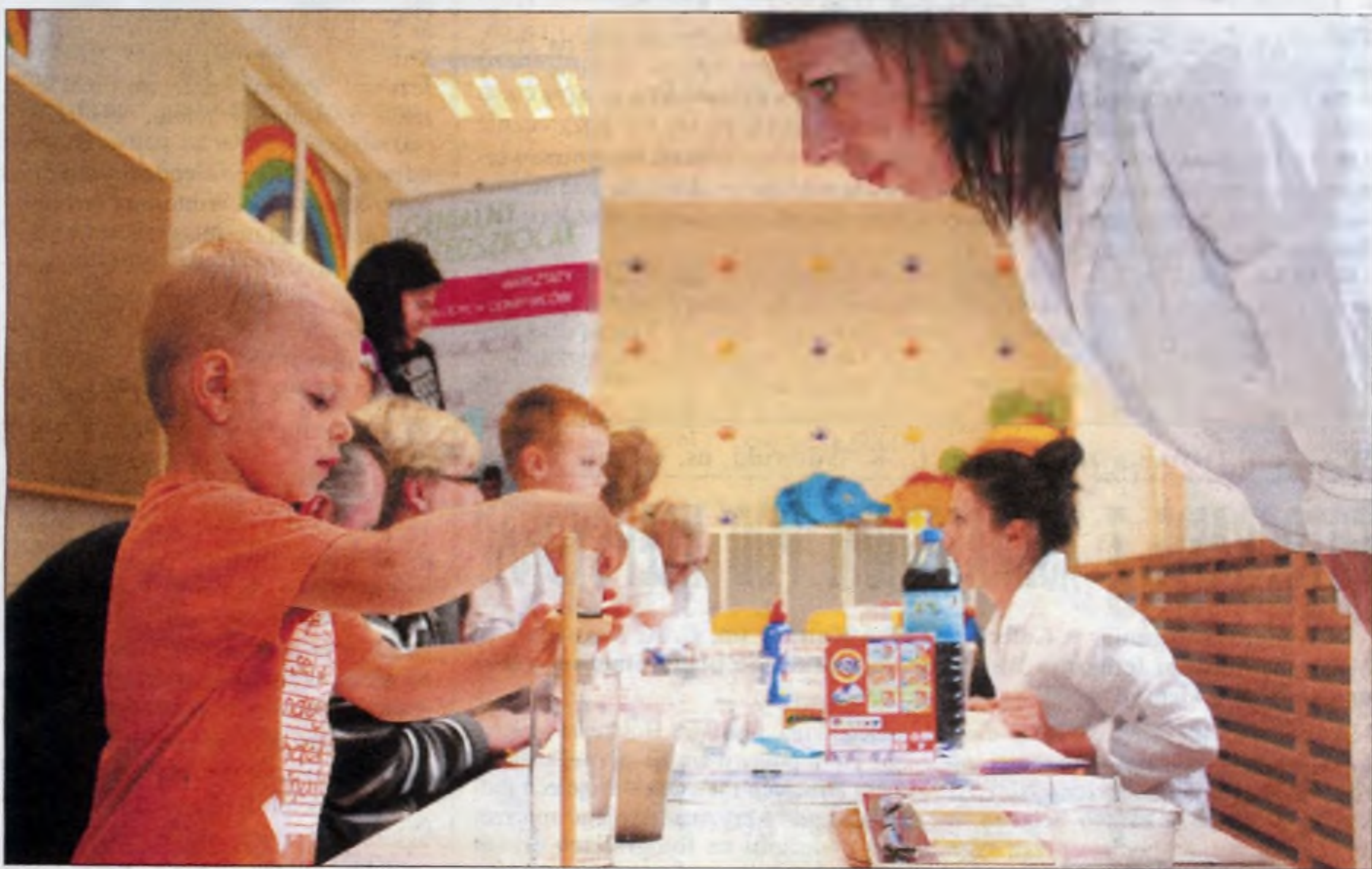
Tak rosną mali naukowcy...