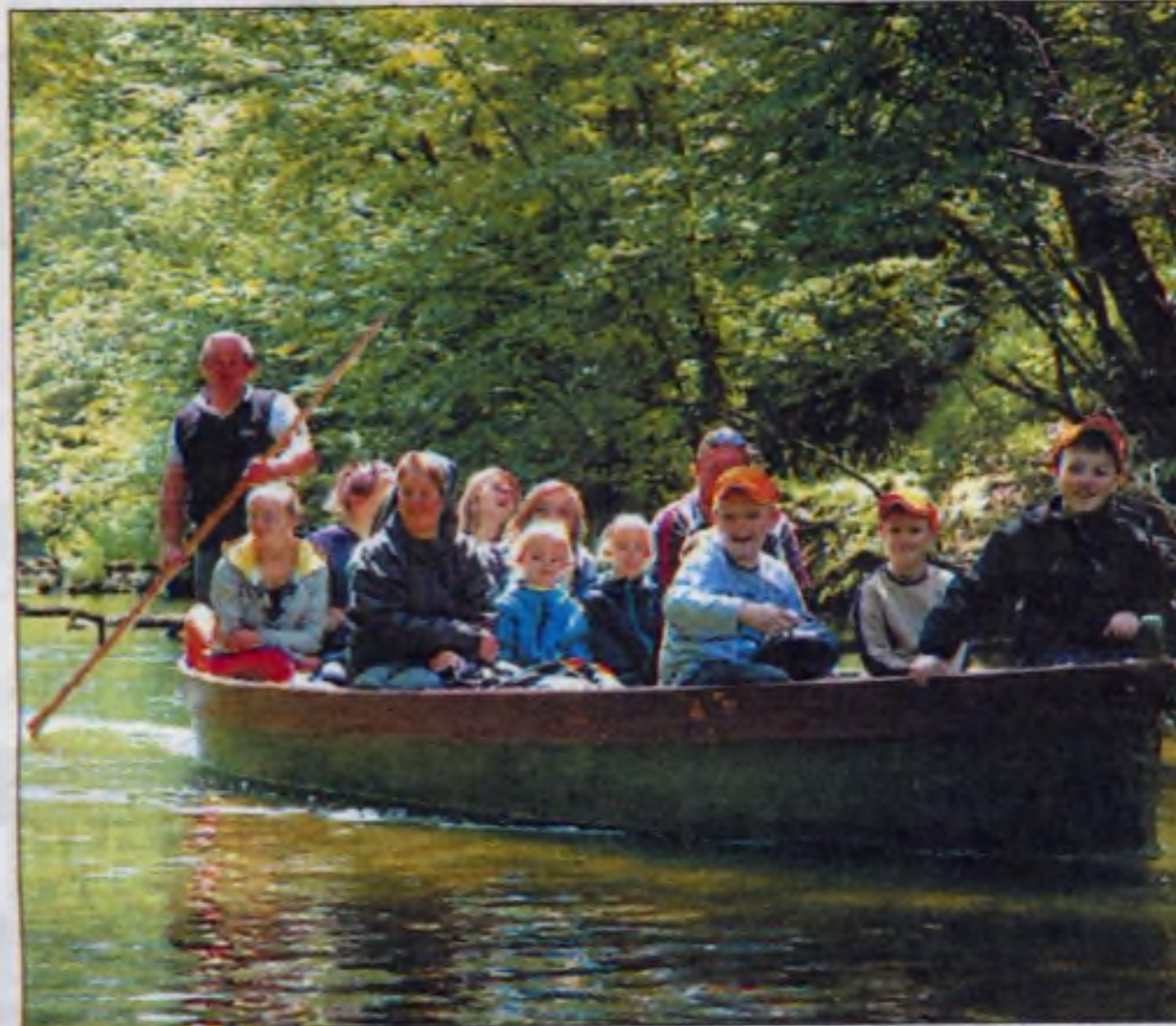
Splyw rzeką Kurtynią.

Nie pierwszy już raz uczniowie Publicznej Szkoły Podstawowej Sióstr Salezjanek z os. Kościuszkowskiego wyjechali na wspólne kolonie. Końcem roku szkolnego uczniowie nie mieli dość nauczycieli i vice versa. Wspólne spędzanie wakacji – to ich sposób na jeszcze lepsze poznawanie się nawzajem.