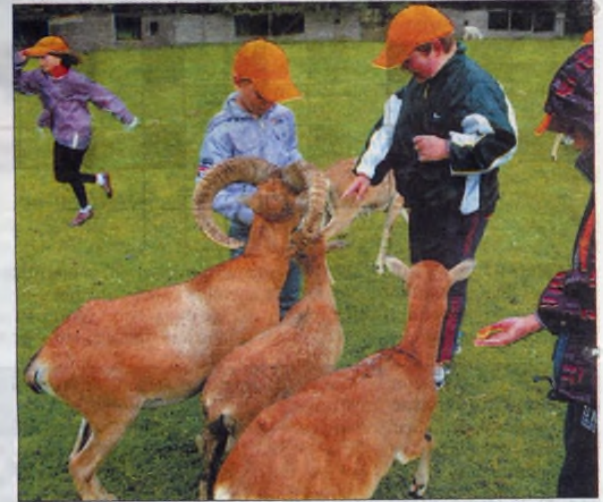
Park dzikich zwierząt w Kadzidłowie.

„Pod opieką 5 wychowawców grupa licząca 46 uczniów udała się w daleką podróż pociągiem do Giżycka. Turnus kolonijny trwał 10 dni i odbył się od 16 do 26 lipca 2012 roku. Podczas pobytu w Giżycku dzieci podziwiała przyrodę Mazur, a także miały możliwość zwiedzić wiele ciekawych miejsc. Krajinę Tysiąca Jezior najlepiej poznaje się z pokładu statków, dlatego też uczestnicy kolonii wzięli udział w rejsie szlakiem Łabędzi, spływie rzeką Kurtynią a także w całonocnym rejsie statkiem do Mikołajek. W stolicy Mazur – Mikołajkach dzieci miały możliwość zakupu pamiątek i spędzić czas na plaży miejskiej, gdzie pod opieką ratowników mogły popływać w jeziorze. W niezapomnianą podróż w czasie uczniowie przenieśli się zwiedzając jeden z najsłynniejszych i najtajniej strzeżonych obiektów II Wojny Światowej – kwatery Adolfa Hitlera zwanej „Wilczym szańcem”, który znajduje się w miejscowości Gierłoż. Dzieci z wielką uwagą i ciekawością słuchały pani przewodnik opowiadającej o życiu wodza Trzeciej Rzeszy i przede wszystkim o słynnym zamachu na Hitlera, właśnie w tym miejscu. Korzystając z bli-