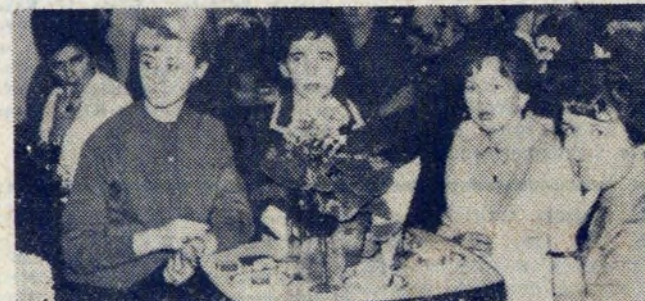
Kobiety z DKT przy DN świętowały Dzień Kobiet w kawiarni ZDK HIL, gdzie przygotowano dla nich miłe występy artystyczne.