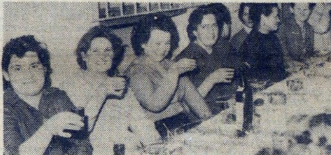
Przy takim świątce mała lampka wina nie zaszkodzi. Na zdrowie pracownicy Dyrekcji Administracyjnej HIL.