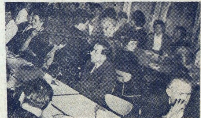
Także w Ognisku Młodych sala była „okupowana” kłkka wieczorów przez kobiety. Oto pracownice z W-3 w otoczeniu swych kolegów na uroczystej wieczornicy.