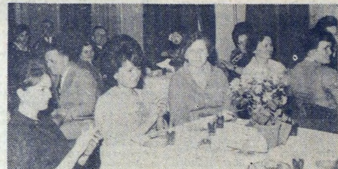
A oto wieczornica dla kobiet z Wydziału Odlewni. Brawa dla wykonawców części artystycznej.