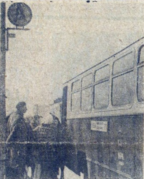
Tabor MPK w Krakowie wzbogacił się ostatnio o kilkanaście nowych wozów autobusowych. Część z nich kursuje w naszej dzielnicy, przyczyniając się do poprawy sytuacji komunikacyjnej.