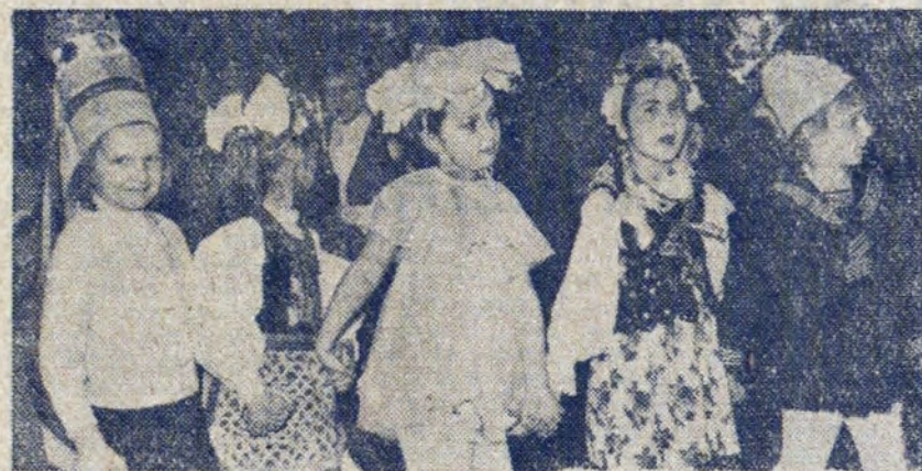
Sezon choinek noworocznych jeszcze trwa. W szkołach i przedszkolach na terenie Nowej Huty odbywają się liczne imprezy choinkowe dla dzieci.

Wprawdzie dużo zrobiono, aby znaki drogowe były aktualne i w dobrym stanie, niemniej jednak zdarzają się takie oto „braki”. Warto odnowić.