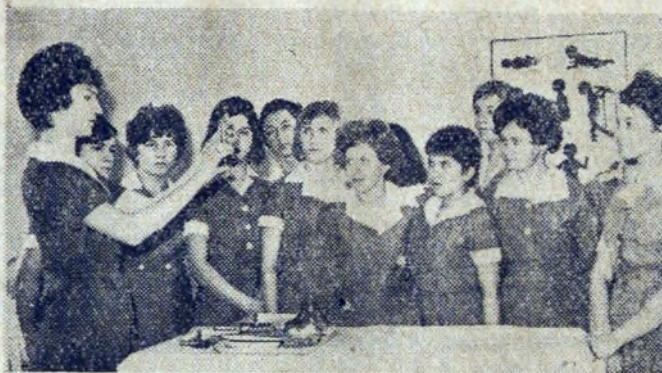
Nauka przygotowania strzykawki do zabiegu.