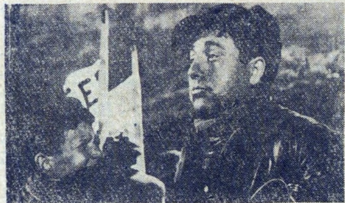
Scena z „Uczty wigilijnej”

Zaraz na początku należy wymienić jednym tchem nazwiska znane przede wszystkim z telewizji szerokim rze-