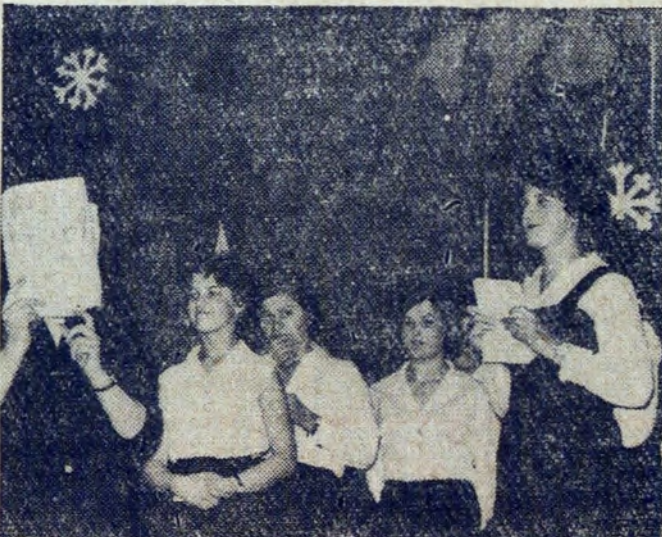
Na występach artystycznych uczennic można było się serdecznie śmiać. Program we własnym przygotowaniu i wykonaniu.