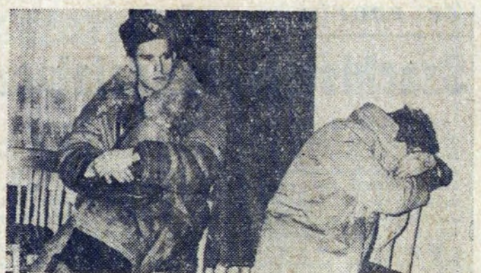
Wstyd pójść do aresztu. Trzeba było o tym pomyśleć wcześniej, obywatelu...