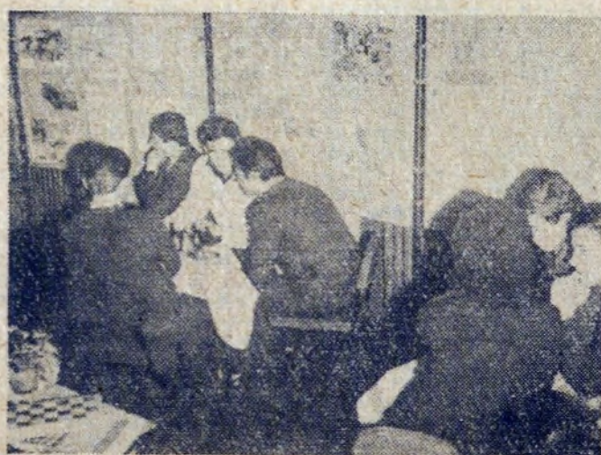
Po odczytaniu — młodzież chętnie gra w szachy.

Krakowa spod okupacji hitlerowskiej. O wypadkach tego okresu mówił przedstawiciel