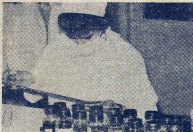
W Nowej Hucie rozwija się coraz lepiej szlachetna iniektywa honorowego krwiodawstwa. Z wielu zakładów pracy zgłaszają się całe grupy pracowników, którzy postanowili oddać jednorazowo krew dla chorych. Na zdjęciu: dokonywanie prób krwi.