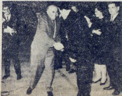
Stawką finałowych rozgrywek były liczne i jak widać cenne nagrody.