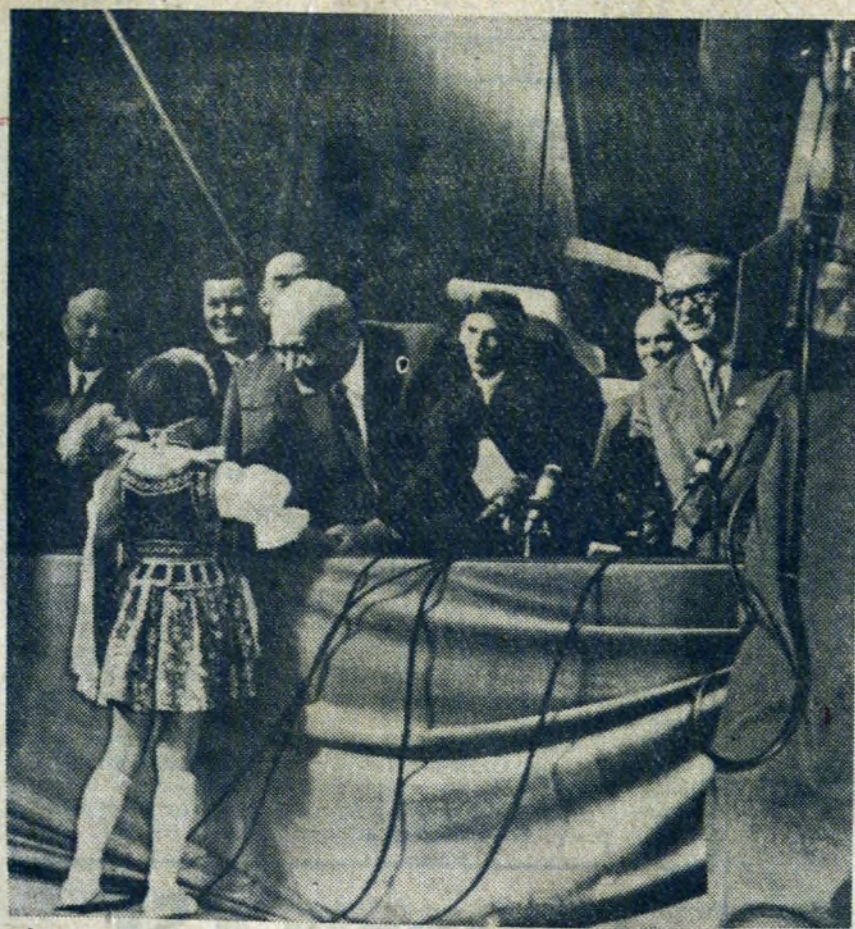
Dostojnego Gościa powitała przed centralną akademią mała krakowianka wręczając wianek białe-czerwonych goździków.