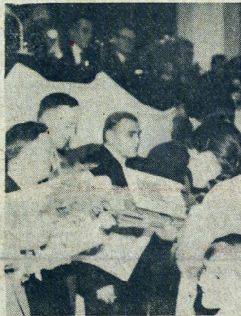
Harcerki wręczyły jubilatowi kwiaty.