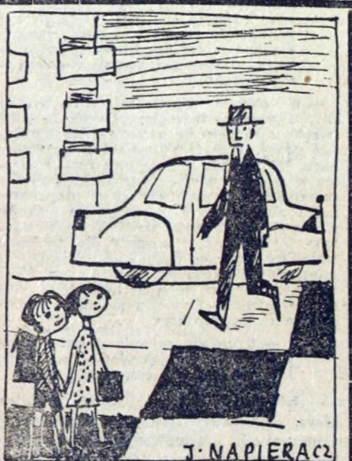
— Dlaczego ten pan nigdy nie jeździ swoim samochodem? — Mamusia mówiła, że on lubi oszczędzać...