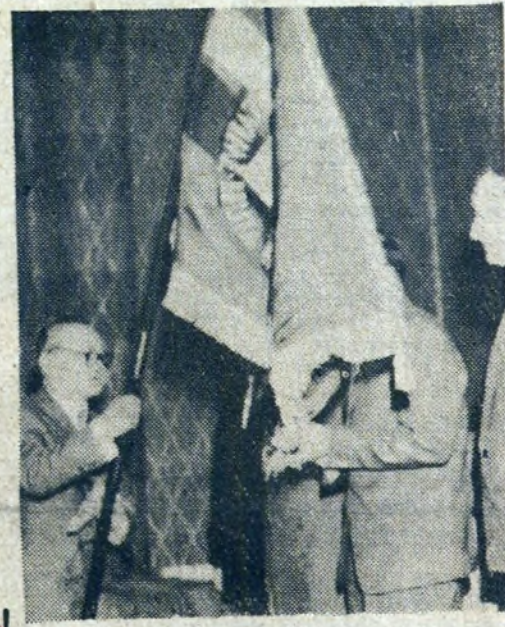
Wręcznie szlansu ufundowanego przez organizację związkową huty dla Rady Zakładowej.